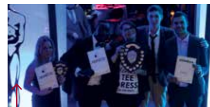
The Awards, udělování cen za nejlepší Student's Society

masívne zvýšili, ale tie pravidlá týkajúca sa samotnej pôžičky, sú úplne jednoduché so super systémom.