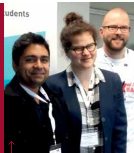
Šla som cez agentúru a tým pádom oni za mňa skoro všetko spravili, takže prihlasovanie nebolo tak náročné

Napadlo tě někdy jet studovat do Velké Británie, ale nemáš samé jedničky a ani si nemůžeš dovolit drahé školné? Zdá se ti, že takovéto studium je pro tebe naprosto nedosažitelné? Tak se nech vyvést z omylu a přečti si zajímavé rozhovory, jak to s těmi univerzitami v zemi s nejvyšším školstvím na světě vlastně funguje. Studovat v Británii může úplně každý, stačí jen chtít!