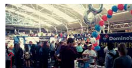
Fresher's day aneb uvítací den na mojej škole

Ono je to takto, každý mezinárodní student je mezi Britmi pán nebo naše středně a základně školy nás učia niečo, čo britské školy nemajú. My sme veľmi popredu vo viacerých veciach. Ďalší fakt je, že hocikto môže sem prísť študovať. Nie je to len pre bohaté.