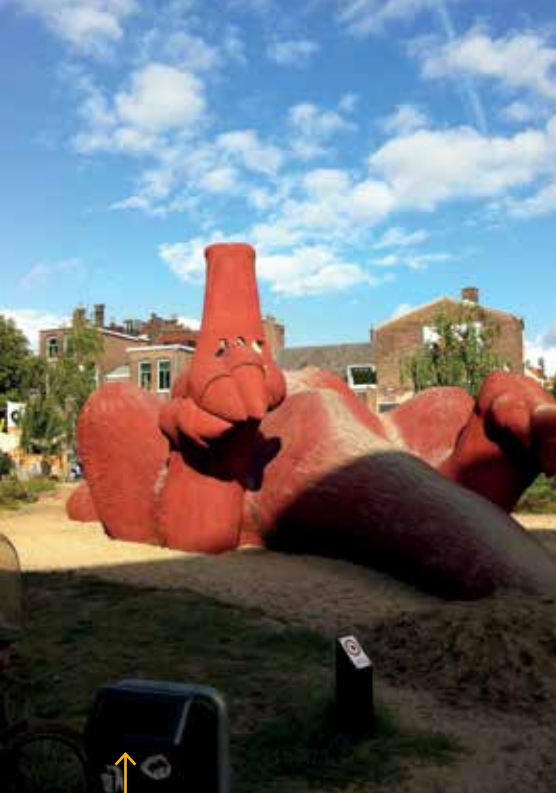
↑ Arnhem – drak v centru