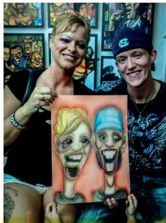
Když se mě zeptaly, jestli je můžu nakreslit jako zombíe, myslela jsem, že si dělají srandu.