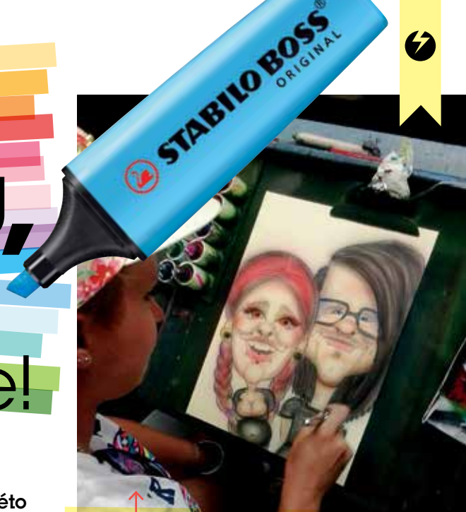
Dokumentce mého výtvarného tvoření.

„Každý měl svůj styl, který nás totálně ohromoval, a my jsme se snažili pozorováním nasát co nejvíc triků.“