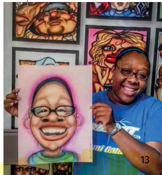
Super sličná černoška.